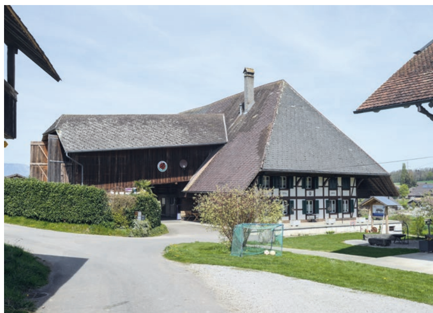
Eines der vielen währschafte Bauernhäuser unterwegs.