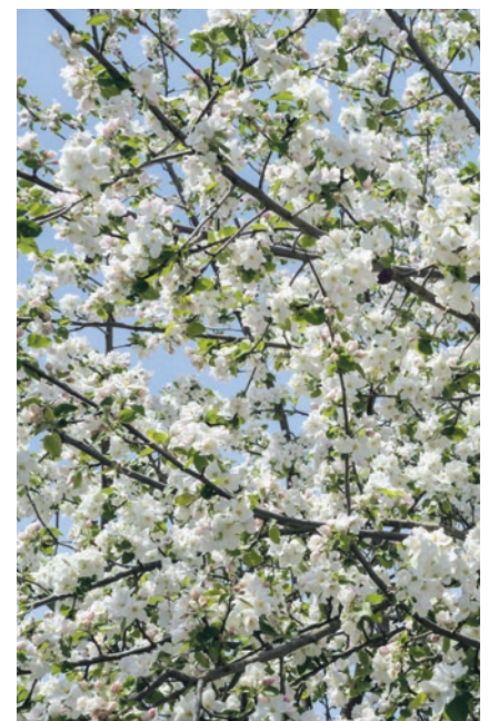
Unterwegs üppig blühende Obstbäume.