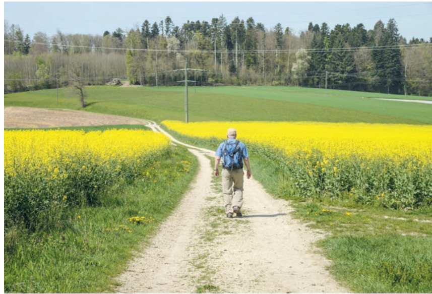
Über lange Strecken bestimmen Rapsfelder das Bild.