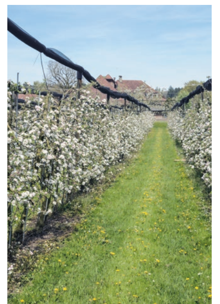
Blick in die Obstanlage.