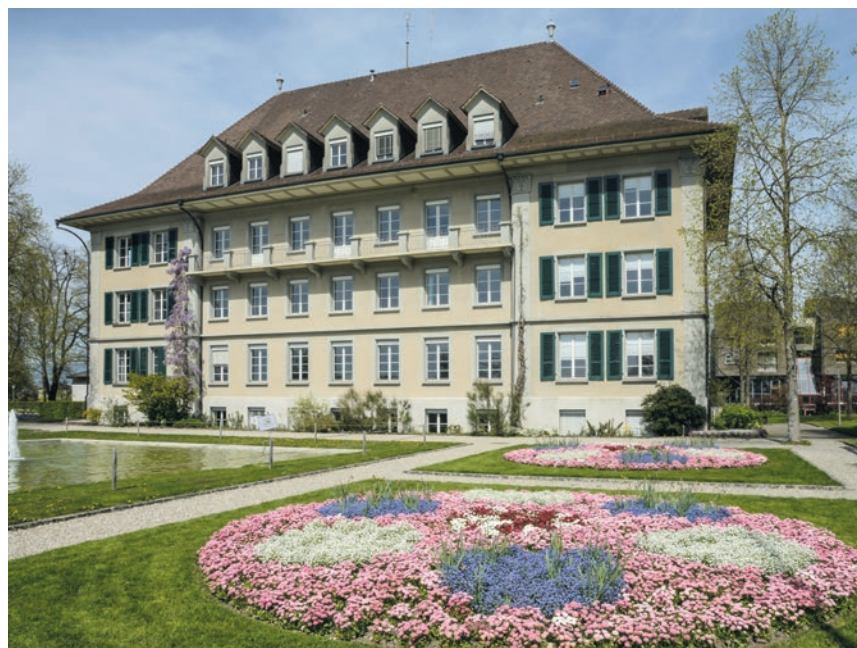
Beliebt und denkmalgeschützt: die Gartenbauschule Oeschberg.