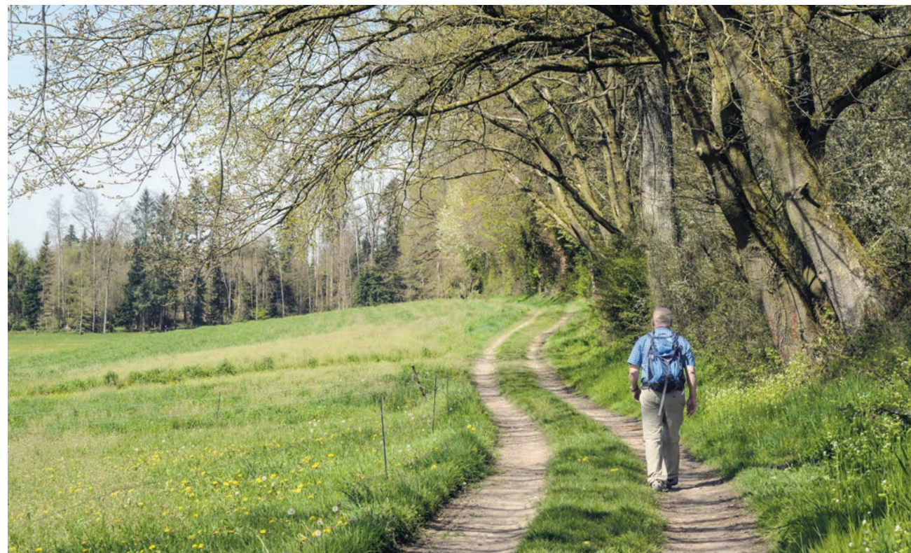
Die botanische Frühlingswanderung führt an lauschigen Waldrändern entlang. Mehr in dieser Ausgabe.

Egal ob Party, Regiofest, Tanzanlass oder Brunch. Hier erfahren Sie alles, was in den nächsten Wochen läuft.