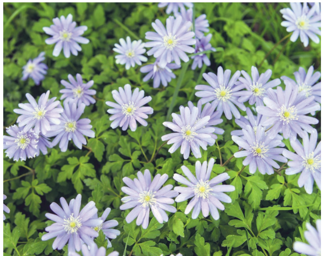
Blaue Asten vor grünem Grund.