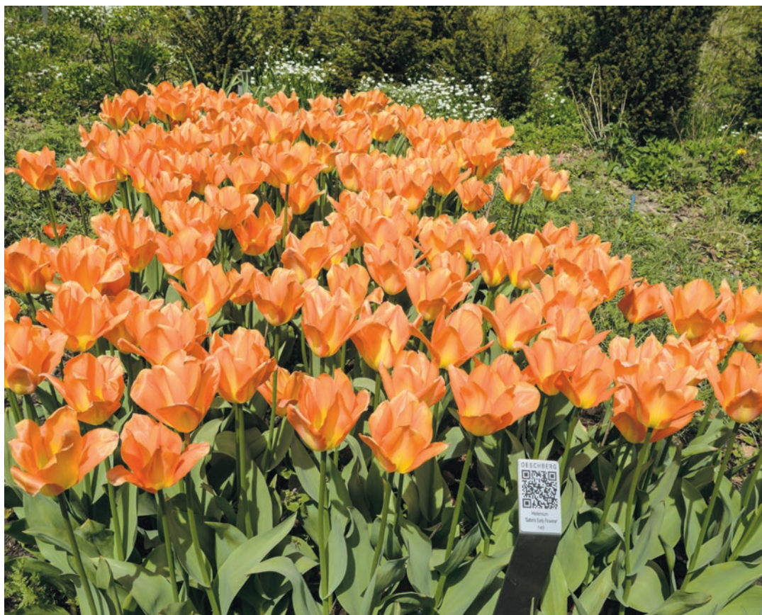
Ein Meer von blühenden Tulpen im Oeschberg.